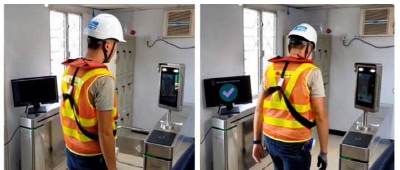
PPE, Life Jacket Checking integrated with facial recognition gate